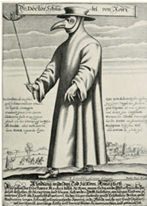
Protocolos médicos

Para ubicar nuestro llamado a la misericordia en estos tiempos visualicemos los dos imaginarios: el de la peste de ayer, siglo XVII con sus médicos e infectados y el de la Covi-19, siglo XXI.