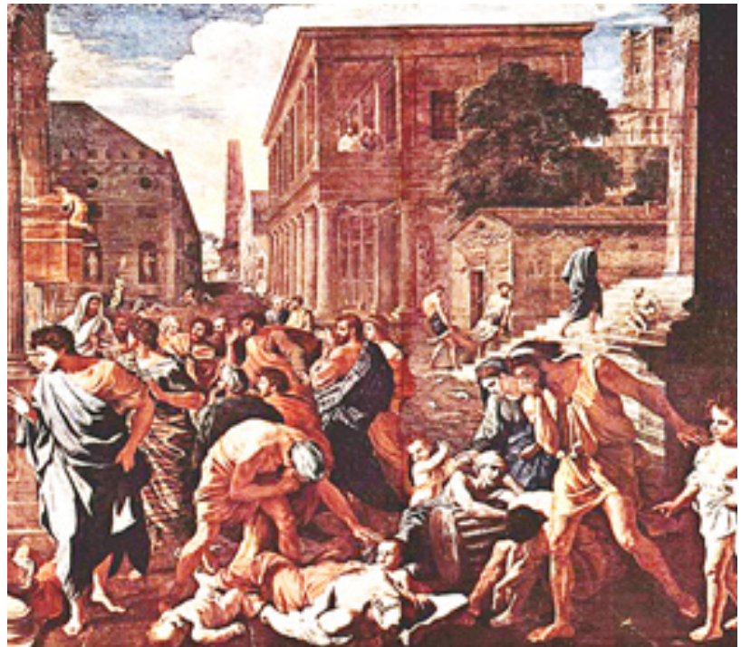
La Peste de Nicolás Poussin (1594-1665, normando como Juan Eudes). (Louvre).